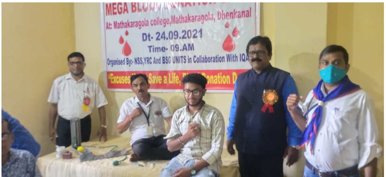
MEGA BLOOD DONATION CAMP, ORGANISED BY YRC ( MATHAKARAGOLA COLLEGE ), DATED 24.09.2021